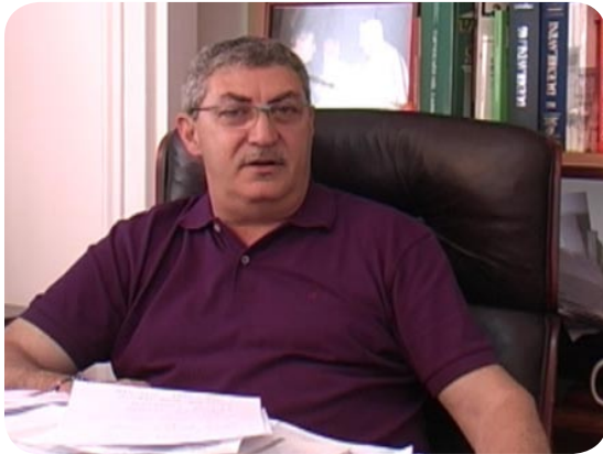
CLICCA SULL'IMMAGINE PER AVVIARE IL FILMATO

saggio della gestione previdenziale e di tutte le prestazioni connesse, ora di competenza dell'IPOST, all'INPS, genererà un periodo di "interregno", con sicure ripercussioni negative.