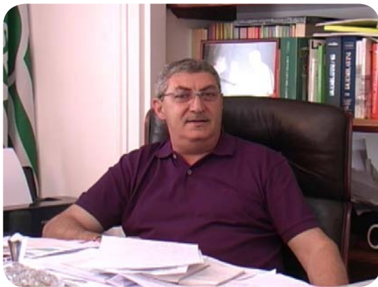
CLICCA SULL'IMMAGINE PER AVVIARE IL FILMATO

Gli effetti della crisi toccano ora in modo evidente il nostro Paese: la manovra finanziaria sui conti pubblici avrà conseguenze dirette e riflesse anche per i nostri lavoratori, per i quali si sta aprendo in questi giorni il confronto sul rinnovo contrattuale. Nell'ambito delle più generali difficoltà di Poste Italiane, dal settore finanziario al settore Corrispondenza.