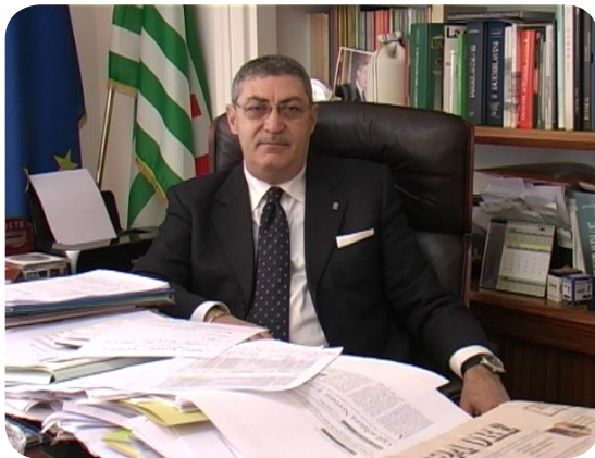
CLICCA SULL'IMMAGINE PER AVVIARE IL FILMATO

Il mese di febbraio 2008 ha visto accelerarsi le fasi di contrattazione in merito ai temi dell'occupazione, per ridare stabilità e restituire efficienza ai settori di Sportelleria e Recapito. Ancora non basta: è necessario che l'Azienda reinvesta le proprie risorse nei settori cardine del proprio servizio.