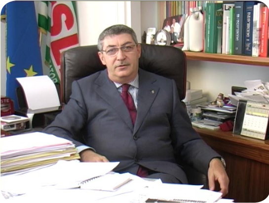
CLICCA SULL'IMMAGINE PER AVVIARE IL FILMATO

2007 di Poste Italiane, e sarà un bilancio fortemente positivo. Se questo, da una parte, è segno che ancora i nostri prodotti reggono sul mercato, che il marchio Poste è ancora appetibile in questo Paese, dall'altra non ci fa stare tranquilli, né completamente appagati". Le carenze nel settore recapito