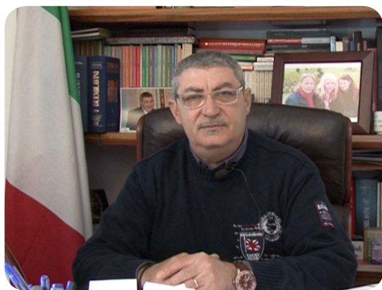
CLICCA SULL'IMMAGINE PER AVVIARE IL FILMATO

Il 13 aprile scenderemo in piazza per sostenere gli esodati. Nel frattempo riprendono le trattative in Poste italiane su mercato privati, premio di risultato, servizi postali, fondo di solidarietà. Proprio nel clima di tensione cresciuto intorno al tavolo unitario e in risposta all'arroganza e all'errore politico della Cgil, abbiamo deciso di indire le elezioni per le Rsa, anziché quelle per le Rsu.