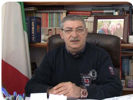
CLICCA SULL'IMMAGINE PER AVVIARE IL FILMATO

simi, tra cui la questione dei seimila lavoratori esodati di Poste Italiane e il problema di come ricreare un fondo di solidarietà per l'accompagnamento all'esodo, nel momento in cui l'Azienda dovesse ricorrere ad esuberi o ad eccedenze, per effetto di inevitabili ristrutturazioni. Si riapre anche la discussione su mercato privati dopo che l'Azienda, unilateralmente, ha portato avanti il progetto di riorganizzazione, con tutti i problemi che si sono riverberati sul territorio. È duplice invece la discussione sui servizi postali: una prima verifica sull'implementazione dell'Accordo del 2010 e poi una discussione, molto delicata, sulle proposte e sui progetti che l'Azienda presenterà per i servizi postali nel prossimo futuro.