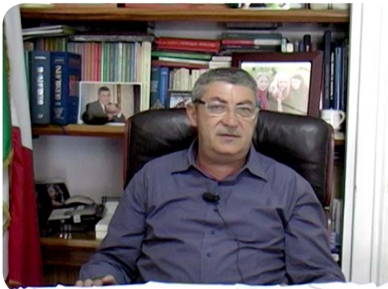
CLICCA SULL'IMMAGINE PER AVVIARE IL FILMATO

La firma separata sul Premio di Risultato, l'avvio della riorganizzazione dei Servizi Postali senza alcun accordo col Sindacato, la presentazione della piattaforma per il rinnovo del Contratto che scadrà a fine anno: queste sono le tre importanti questioni che in questi giorni impegnano l'Slp Cisl.