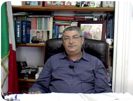
CLICCA SULL'IMMAGINE PER AVVIARE IL FILMATO

partire unilateralmente e lo farà probabilmente a partire dal giorno 16 di luglio. Voi tutti sapete che il progetto prevede, in maniera del tutto strumentale, di cominciare in cinque regioni campione (Piemonte, Emilia Romagna, Toscana, Marche e Basilicata). Noi riteniamo che questa "furbizia" da parte dell'Azienda non porterà da nessuna parte, anche perché sappiamo, dati alla mano, che alla fine di questo percorso, quando la riorganizzazione interesserà tutte le regioni d'Italia si arriverà a circa 10mila tagli di posti di lavoro, donne e uomini che saranno messi o in mobilità o spostati e utilizzati altrove.